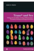
Psychosozial-Verlag, Gießen 2020, 147 S., 19,90 Euro

K* Stern, Einzel- und Paartherapeut_in und Trans*Beratung in Hamburg, www.praxis-kstern.de